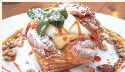
Chou à la crème 700

エスプレッソの香り高いほろ苦さと チーズとカスタードの優しい甘味が重なる大人の味。