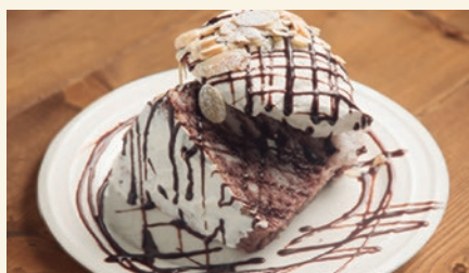
Angel Food Cake Chocolat 700