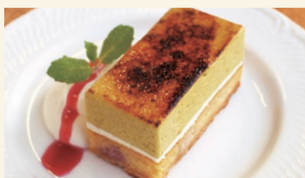
Pistachio & Raspberry Chiboust 770