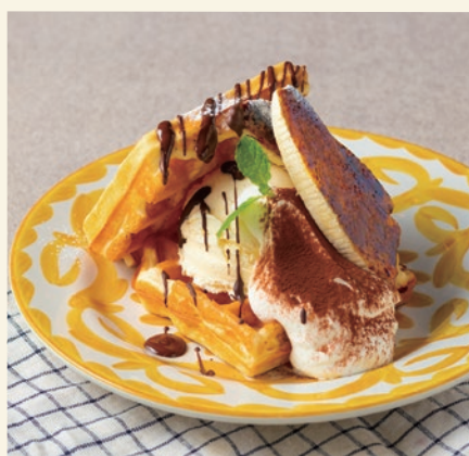
Waffle Choco & Banana 1200

焼きたてのワッフルに冷たいアイスに メープルシロップをかけてお召しあがりください！