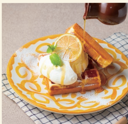
Waffle Vanilla & Maple 1000