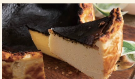
Basque Cheese Cake 770