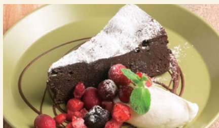
Gâteau au chocolat 800