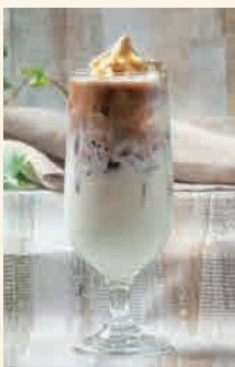
アフォガードラテ AFFOGATO LATTE 880