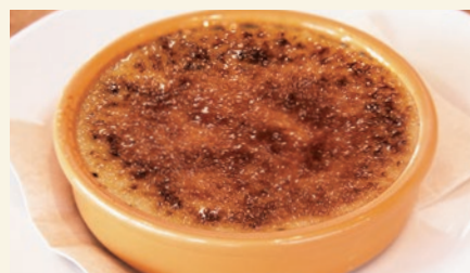
Crème brûlée 660