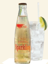
NOSE GINGER ALE