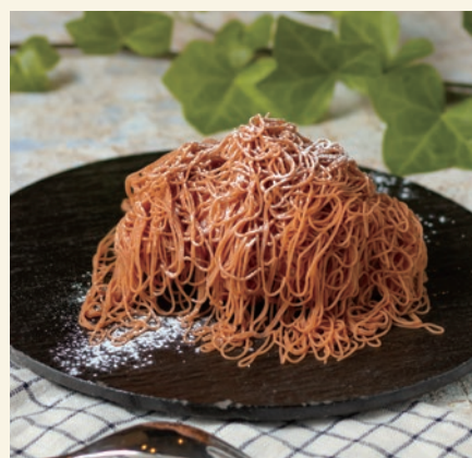
Mont Blanc 1100